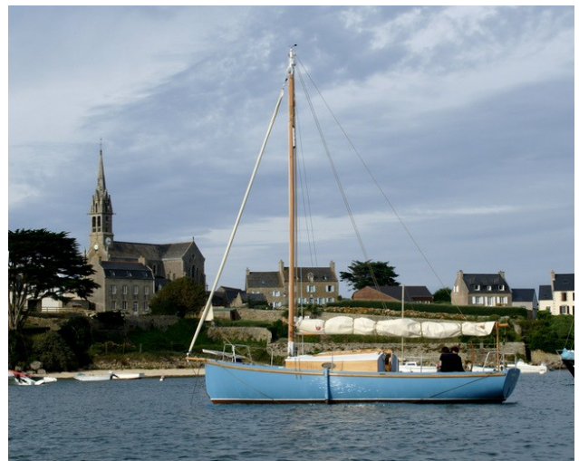
Pen-Hir prêt à s'échouer à l'Ile de Batz

Les yachts classiques ont une « quille longue » avec un gouvernail à son extrémité arrière. Sur les bateaux modernes, la recherche de performances et d'une surface mouillée réduite a conduit à monter un gouvernail séparé de l'aileron de lest. Dans le cas de Pen-Hir, j'ai envisagé cette solution, mais avec un tirant d'eau modéré et une quille tout de même assez longue pour assurer la stabilité lors d'un béquillage, comme on le pratiquait dans les années 70. Pen-Hir doit pouvoir échouer dans les petits ports et échapper aux marinas modernes.