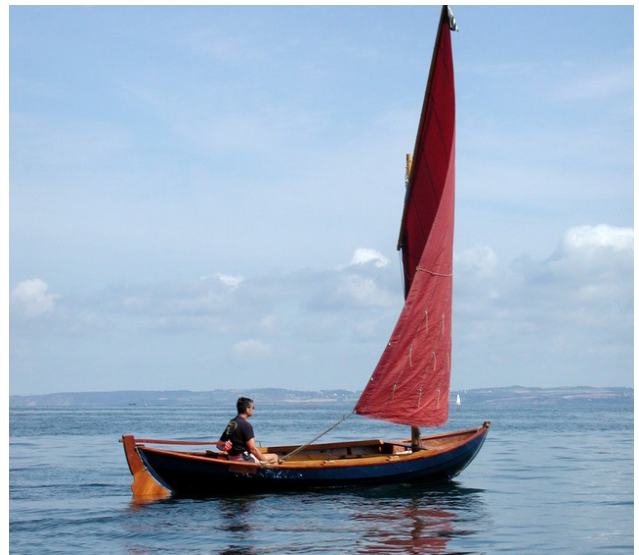
Voile au tiers amurée en pied de mât (toujours du même côté du mât)

Un nouveau plan de voilure de sloup au tiers (à voile au tiers et foc) vient s'ajouter aux trois autres. Il offre la possibilité d'avancer le mât et naviguer sans foc. On dispose alors d'un gréement simple pour naviguer en solitaire ou dans la brise.