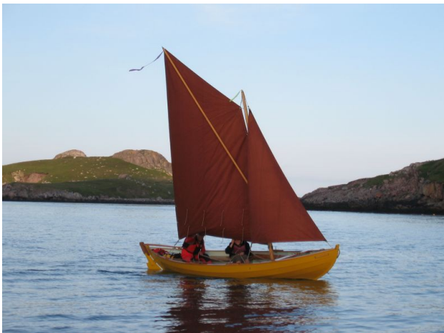
Sloup à livarde, à saint Pierre et Miquelon