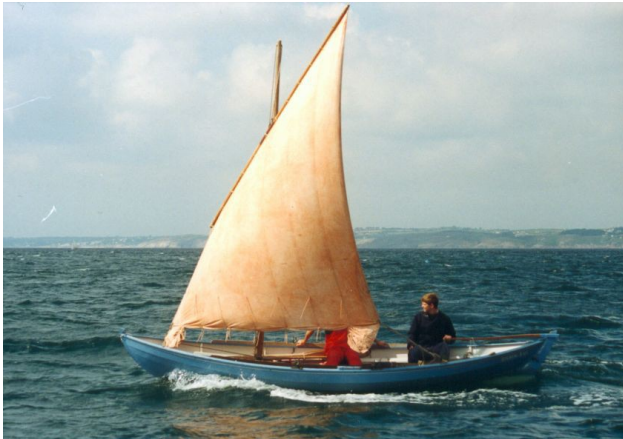
Voile au tiers amurée en abord sur Youkou-Lili, premier du nom

Youkou-Lili est un bateau que j'ai imaginé, dessiné, construit dans mon garage et lancé en 1985. Je voulais un bateau qui soit à la fois très bon à la voile et tout autant à l'aviron. Les formes de Youkou-Lili, inspirées à la fois du Faering norvégien (arrière pointu) et du Swamscott dory américain (sole ou fond plat), en font un excellent bateau d'aviron en mer.