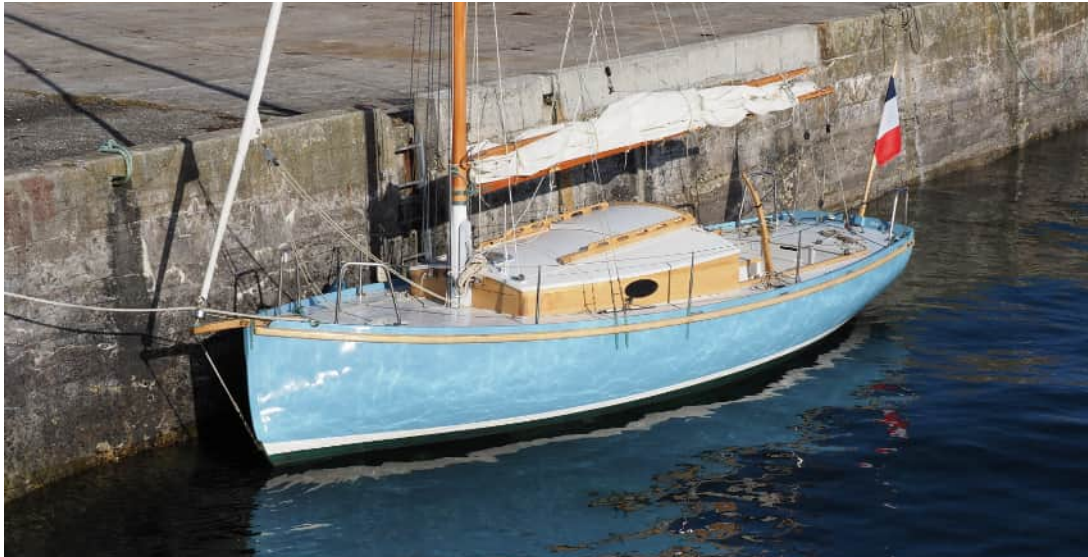
Pen-Hir #1 à Molène