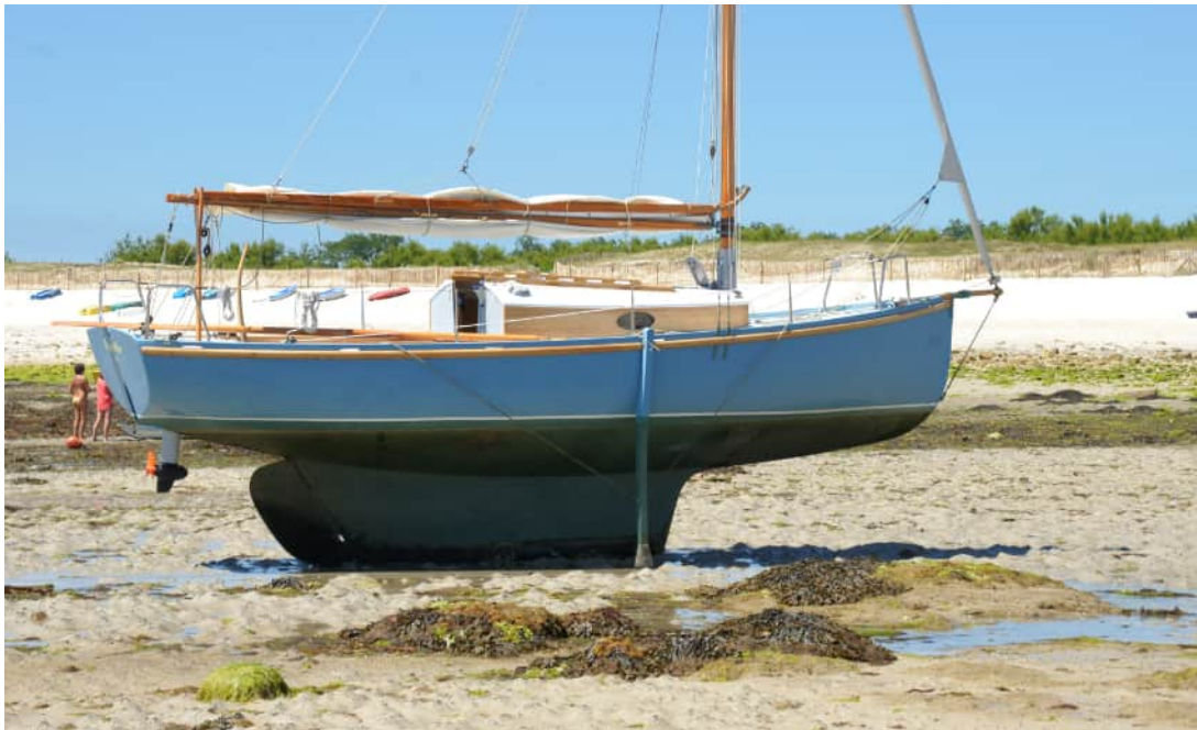
Pen-Hir #1 béquillage à Hoedic