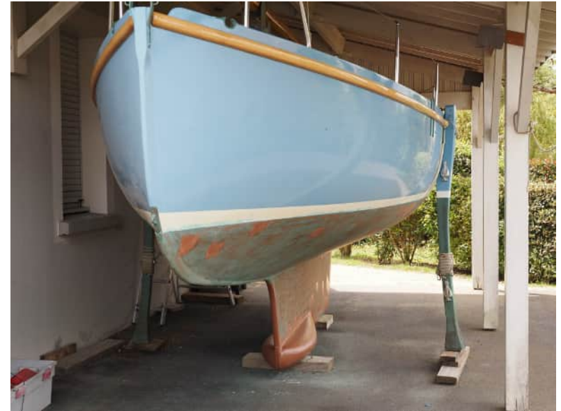
Pen-Hir #1 avant mise à l'eau 2024