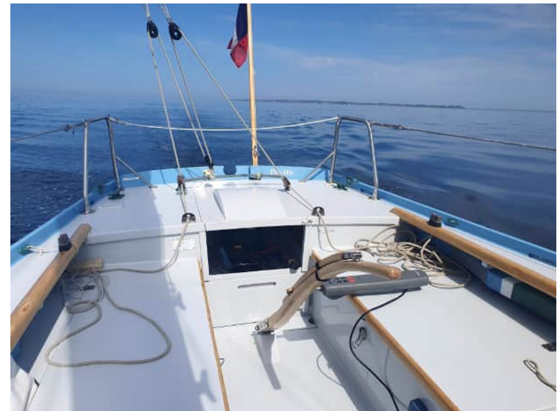
Pen-Hir #1 avec son nouveau moteur thermique 6 ch Cockpit repeint en 2024