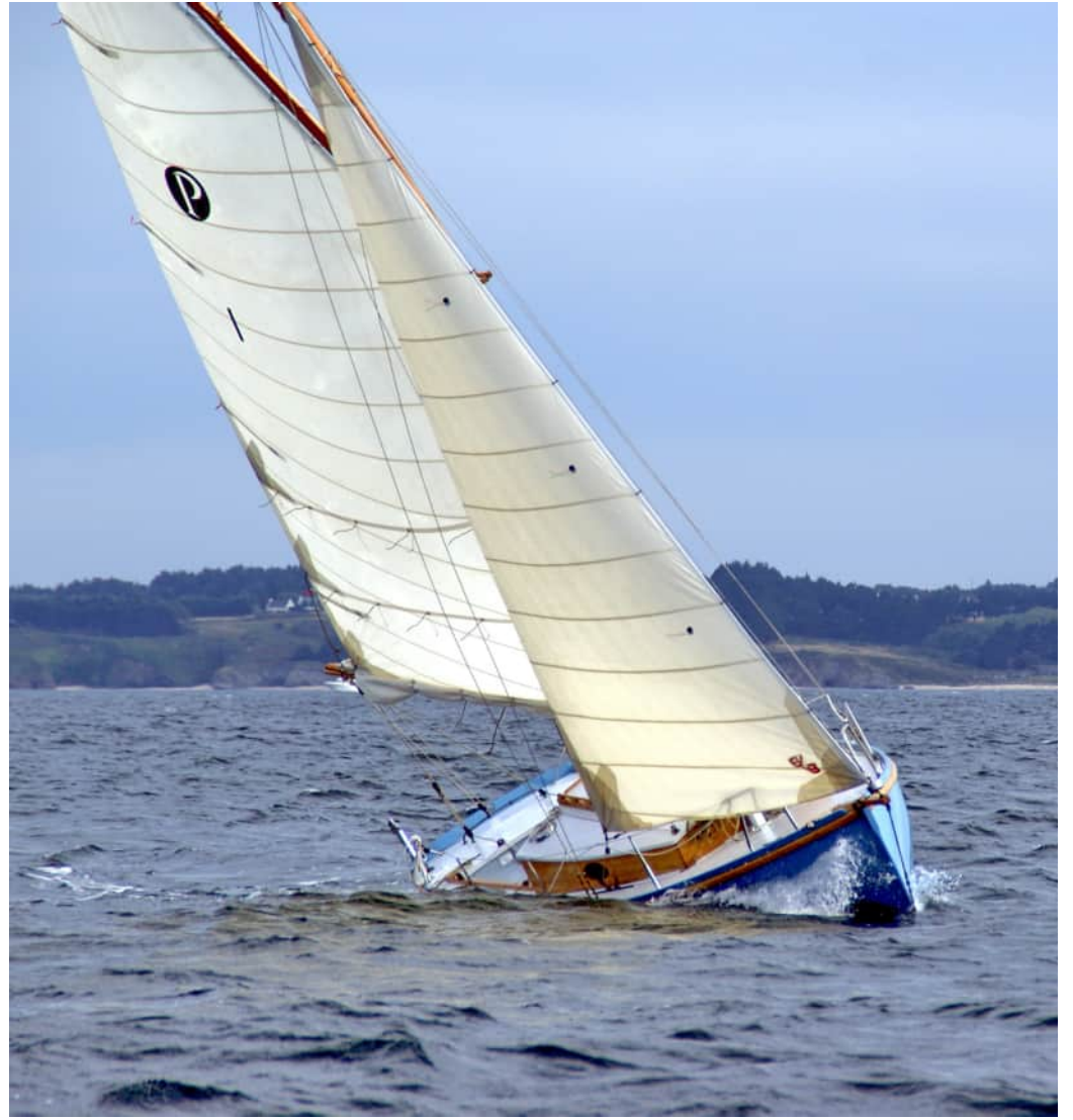
Pen-Hir #1 sous voile