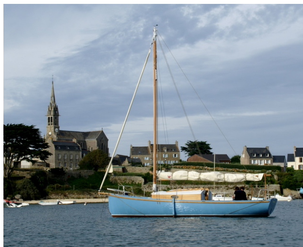
Pen-Hir prêt à s'échouer à l'Île de Batz

Les yachts classiques ont une « quille longue » avec un gouvernail à son extrémité arrière. Sur les bateaux modernes, la recherche de performances et d'une surface mouillée réduite a conduit à monter un gouvernail séparé de l'aileron de lest. Dans le cas de Pen-Hir, j'ai envisagé cette solution, pour finalement préférer la solution classique avec un tirant d'eau modéré et une quille de faible étendue longitudinale, mais tout de même assez longue pour assurer la stabilité lors d'un béquillage. Pen-Hir doit pouvoir échouer dans les petits ports et échapper aux marinas modernes.