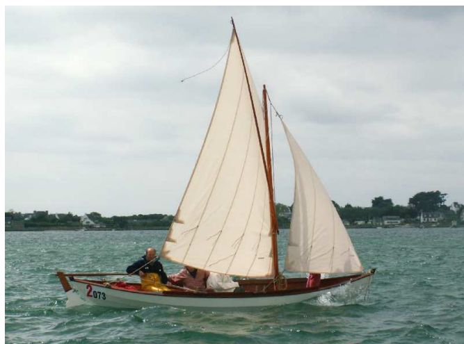
Grément à livarde

Youkou-Lili a été proposé ensuite sous forme de dossier de construction et le nom de mon bateau est devenu nom de la série. L'un d'eux a gagné dans sa catégorie une édition du « Great Glenn Raid » en Ecosse, confirmant les qualités exceptionnelles du