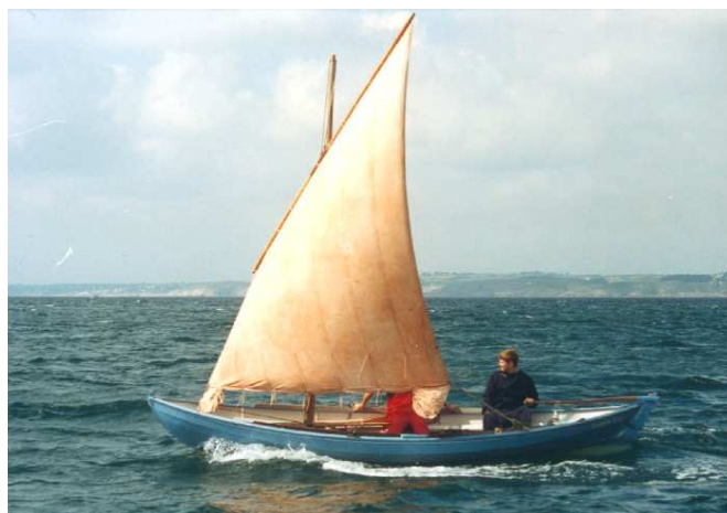
Voile au tiers amurée en abord

Kits (contreplaqué, bois massif) et toutes fournitures peuvent être obtenus auprès de Icarai : 4 avenue Louis Lumière - 50100 Cherbourg Tél : 02 33 41 38 91 - E-mail : nvivier@icarai.net