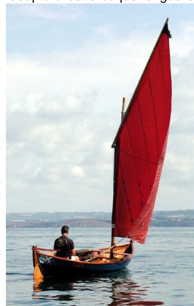
Voile au tiers simple